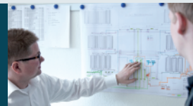
FUTTERMITTEL Verladung von Kraftfutter